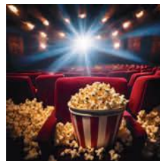
Grafiken: eij by canva.com

Lust auf einen Filmabend mit Popcorn und Freunden? Wir zeigen die besten Filme des Jahres!