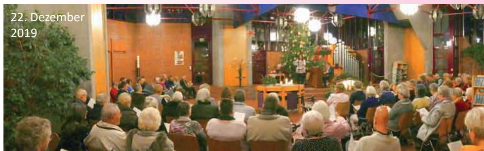
22. Dezember 2019

liche“ reicht das Programm zum Mitsingen, das immer wieder unterbrochen wird durch weihnachtliche Texte nicht nur aus der Bibel. Eintritt frei, Spenden willkommen!