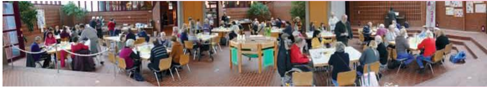
Grafik und Foto: Szemeredy

Unsere Kirche wird auch im kommenden Jahr wieder zum Gastraum und zur „Auf-ladestation“ für Leib und Seele. In kalter Zeit brauchen wir warme Mahlzeiten und warme Worte zusammen mit einem warmen Herzen. Das alles möchten wir weitergeben in der Woche vom 2 bis 9. Februar zwischen 12 und 14.30 Uhr an den Tischen rund um den Altar in unserer Kirche. Lassen Sie sich einladen, bei uns zu Gast zu sein! Wenn Sie Lust und Möglichkeit haben, unser Projekt zu unterstützen, dann